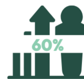
Taux d'insertion en emploi