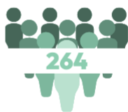
NB de stagiaires formés